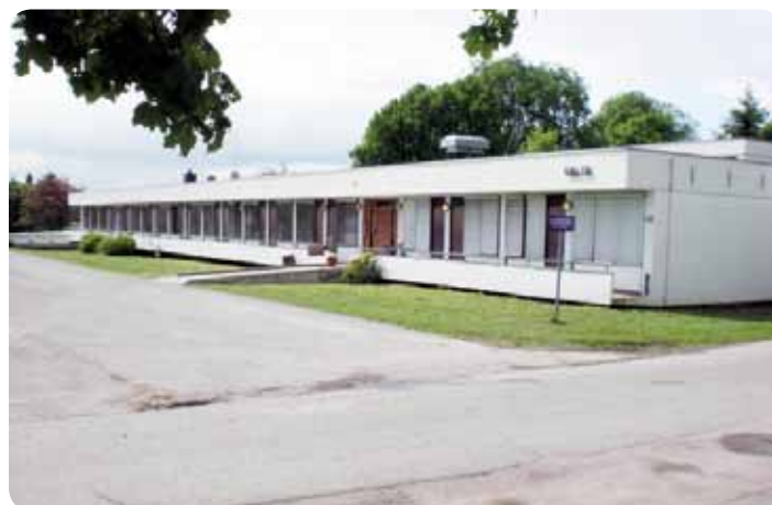
Villa Eik.

I begynnelsen av september året etter flyttet vi. Flere av de