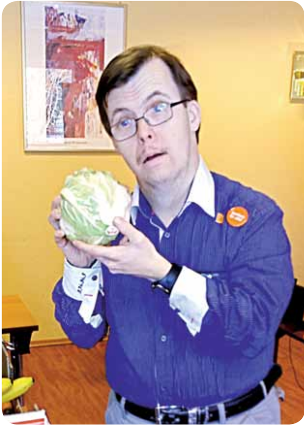
Sunn og god mat. Vi lagde også forskjellige småretter.