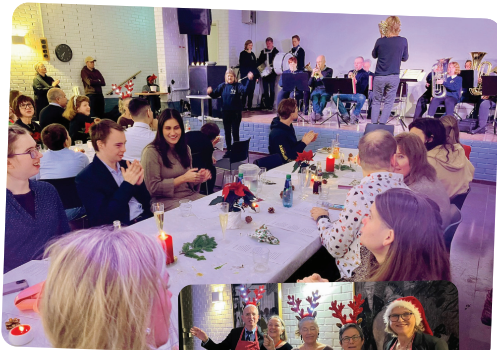
Torshov-korpset i full aktivitet

Det er en stund til, men vi gleder oss allerede til årets julebord!