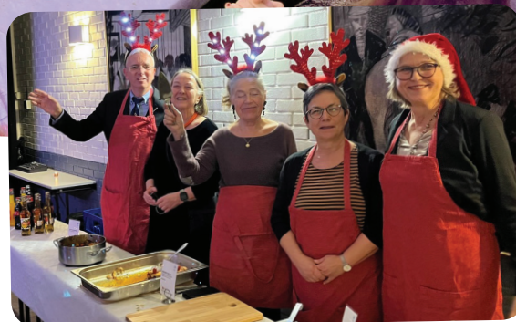
God stemning også bak serveringsbordet.